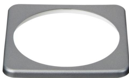
BMV-ring voor vierkant front