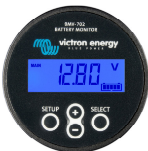
BMV 702 Black